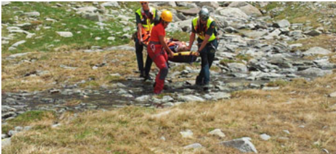
Conocer el territorio y llevar el equipamiento adecuado pueden minimizar los riesgos

cabida a los clubes. Teníamos especial interés en que hubiese de las tres provincias, que hubiese gente joven y que estuviera también conformado por mujeres, que en nuestro deporte son más o menos un tercio de practicantes. Lo hemos conseguido con 17 personas, logramos una representación variada, que supone una verdadera radiografía del panorama del montañismo y de los clubes aragoneses.