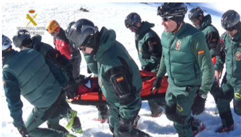
La Guardia Civil ha realizado alrededor de 400 rescates en lo que va de año en Aragón

Sobre todo hay que dejar dicho el itinerario que se va a realizar y no cambiar sobre la marcha si es posible. Estas cosas que a veces parecen básicas, se olvidan. Pero desde luego, la montaña en invierno es para los expertos.